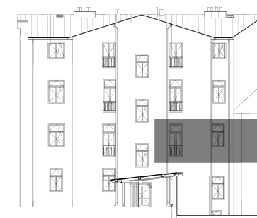
Pohled na dům