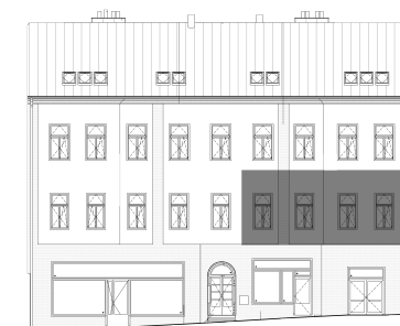
Pohled na dům